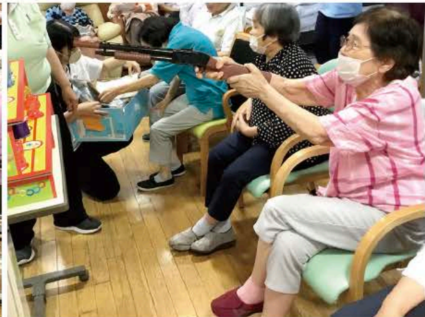
◀ (右) よく狙って (左) 何個釣れたかな？

中延在宅サービスセンターでは、利用者にとって楽しい時間を過ごしていただけるように季節ごとに様々なイベントを提供しています。