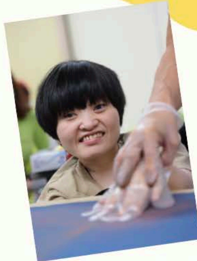
▲作っている際の表情も、作品の一部です