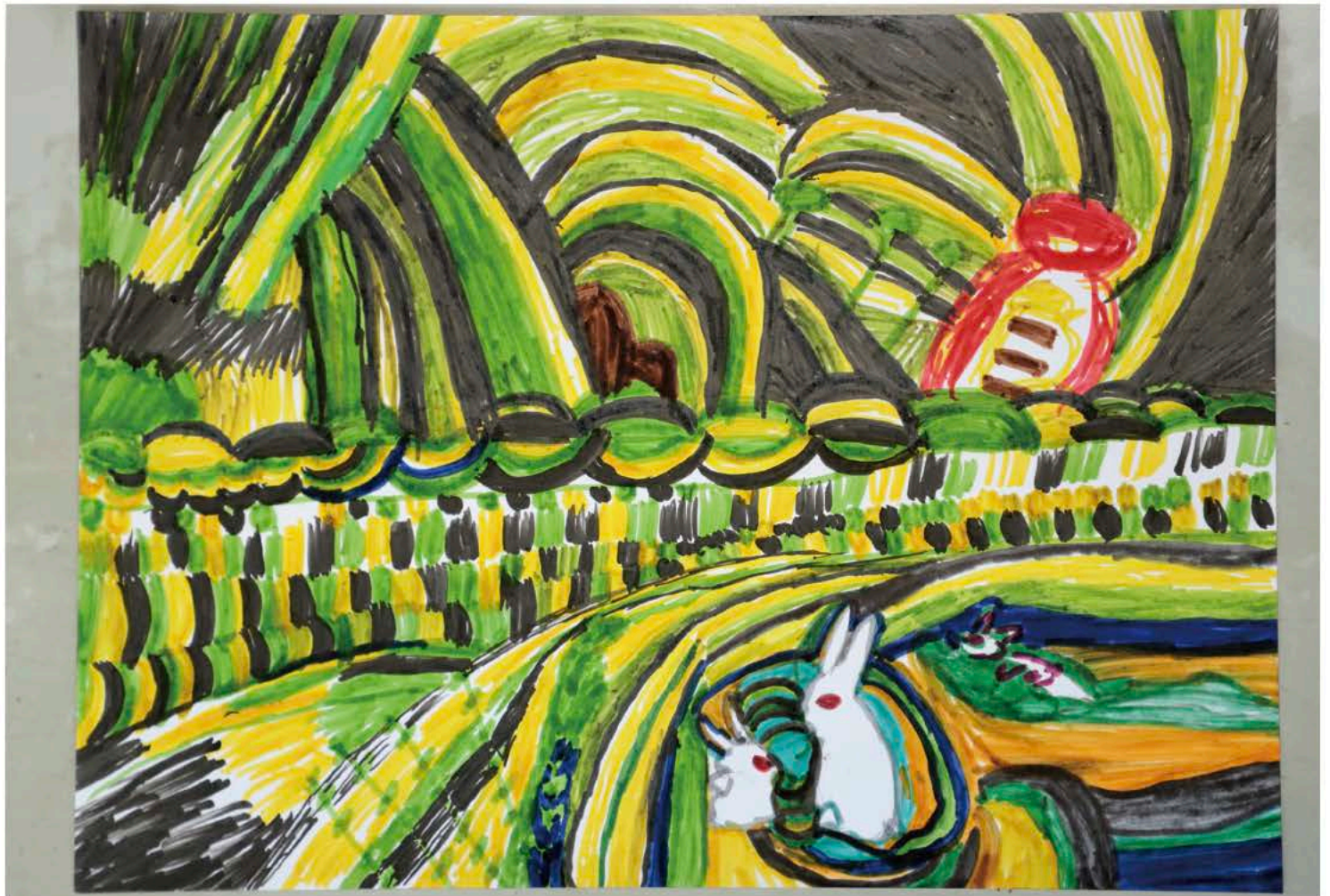
入選作品 制作：大森昭雄様 作品名「月世界」