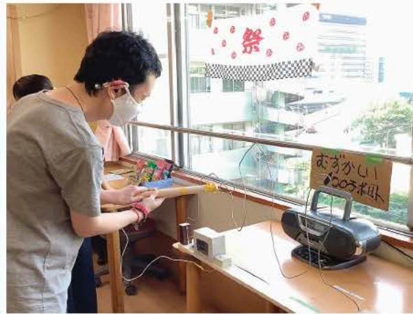
◀(右) イライラ棒に挑戦! ゴールまでいけるかな? (左) 夏を感じています!

かもめ園では、毎年恒例の「夏季行事」を行いました。利用者に「夏」を感じていただけるよう、職員が毎年、工夫を凝らし準備をしています。