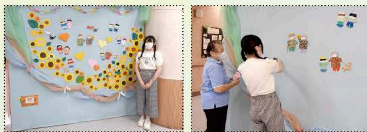
▲「アルツハイマー月間9月」に合わせた作品制作をしました

婦を子どもたち、犬や猫の折り紙を夏の花で囲み、優しい社会を目指してという願いを込めて、装飾を完成させました。「つながる壁」は、玄関正面にあり、利用者はじめ多くの方に見ていただき、フォトスポットにもなっています。「また飾りたい。」と感想をいただき体験ボランティアを終了しました。ぜひ、またお手伝いに来てください。