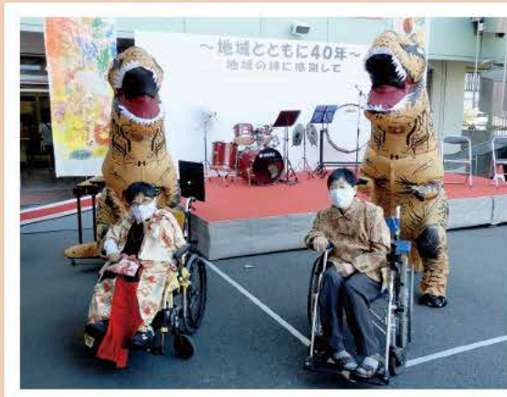
▲ 昨年のフェスタでのひとこま 仮装の怪獣と一緒にポーズ

10月20日(日) 時間：11:00～14:30 場所：品川総合福祉センター本部駐車場(品川区八潮5-1-1) 内容：八潮学園吹奏楽部・キッズチアダンス・リズム舞踊・ファッションショー・模擬店・作品販売 他