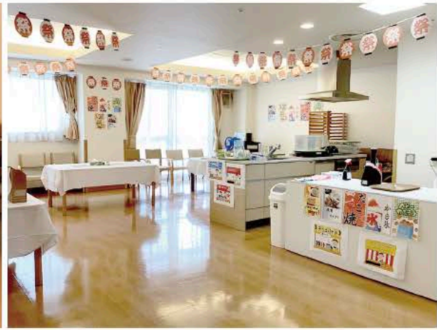
◀ (右) 会場の様子。雰囲気華やかに演出 (左) 素敵な笑顔でヨーヨー釣り

たびたび訪れる感染症の脅威などにより、余暇活動の規模縮小や中止と思うように開催できないことがありました。しかし、人が生きていく上で「楽しみ」を持つ事や「明るい気持ち」になれる時間はとても大切なもの。