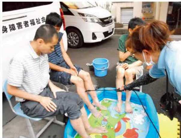
◀(右) ミストを脚に浴びて、気持ちいい! (左) 何味にしようかな?