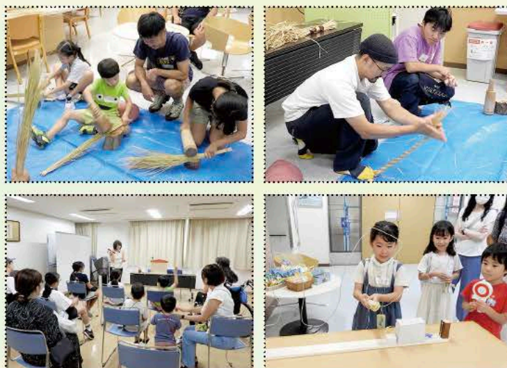
▲今年も様々なメニューで楽しみました