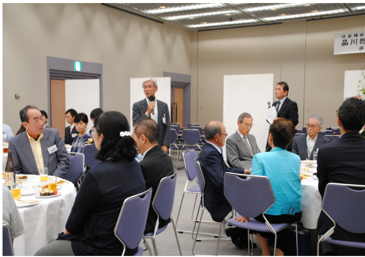
懇親会で、なごやかな自己紹介の様子

総会では、平成二十九年度事業報告・会計報告、平成三十年度事業計画、予算案が議案として提案され、承認されました。主な後援会の昨年度の事業としては、