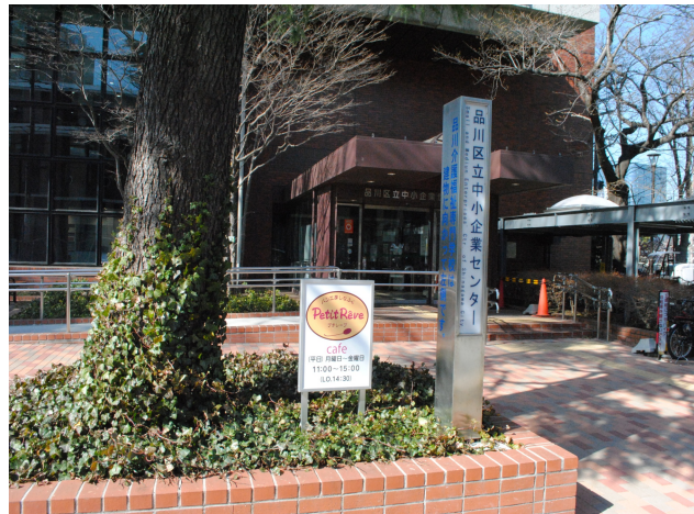
プチレーブカフェのある中小企業センターの前に看板が設置されました。(後援会寄贈)

品川区立中小企業センター前にプチレーブカフェの看板の取り付け、店舗前バルコニーに手すり、カウンターテーブルが設置されました。